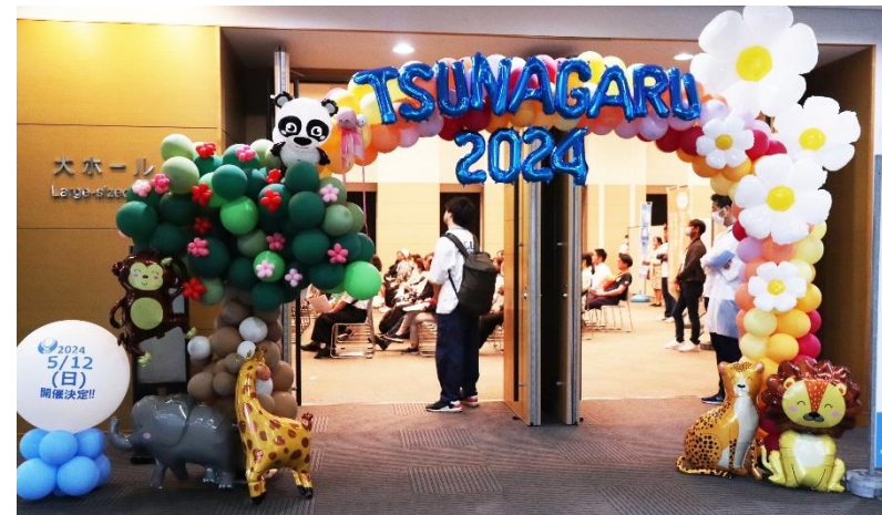
たくさんの 動物さん達がお出迎え♪