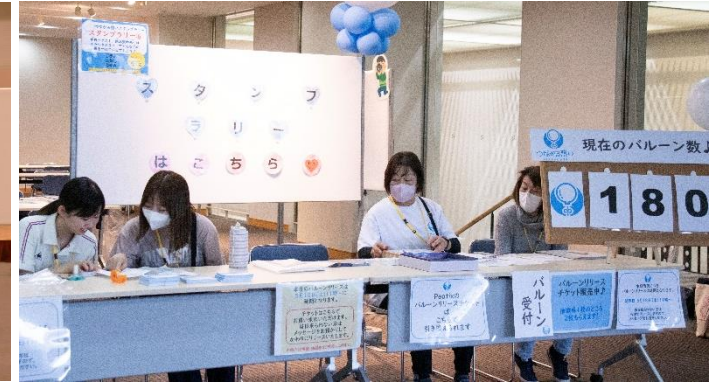
スタンプラリー・当日バルーン販売