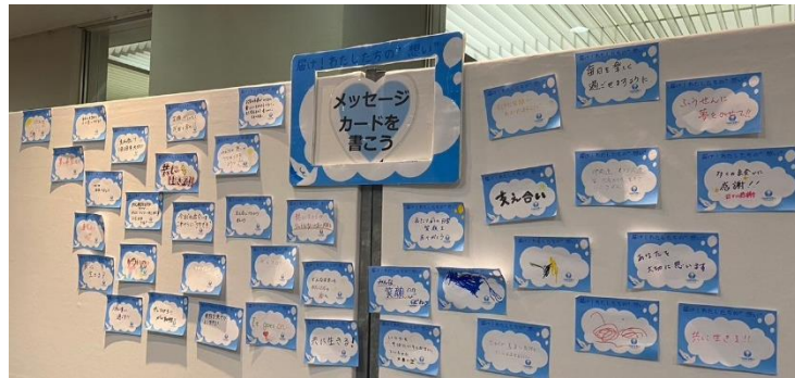
つながるメッセージボード