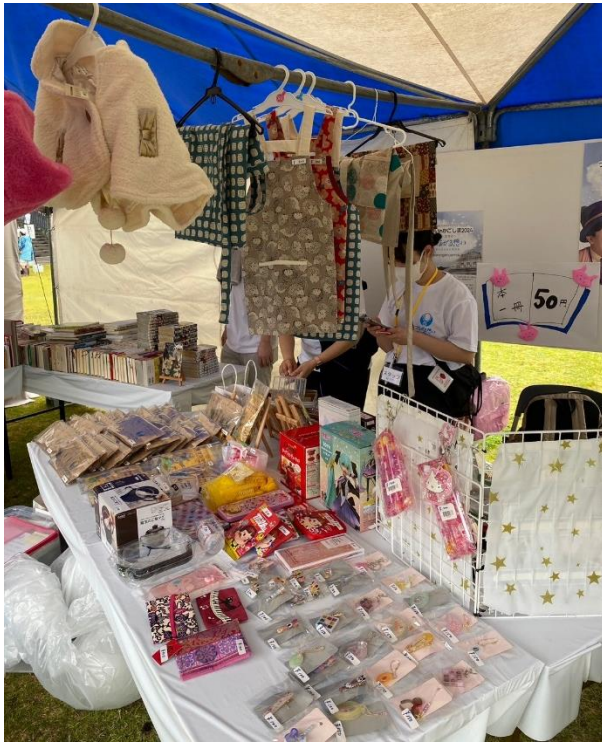
つながるマルシェにはたくさんの提供品 をいただきました