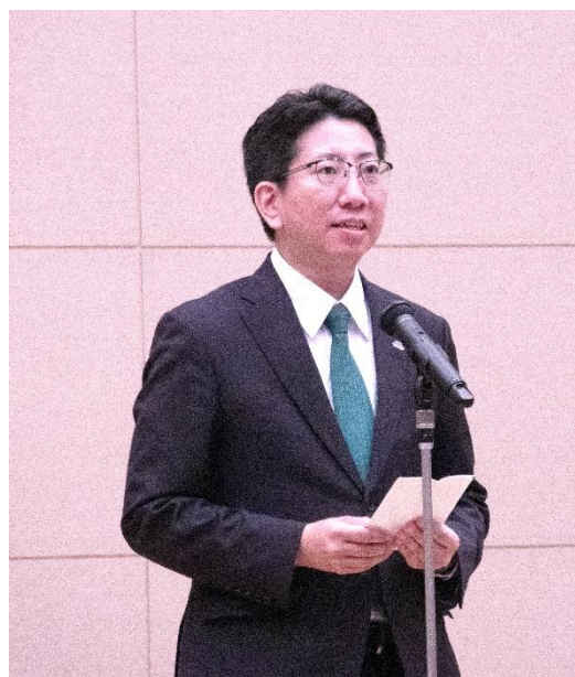
下鶴隆央様 (鹿児島市長)